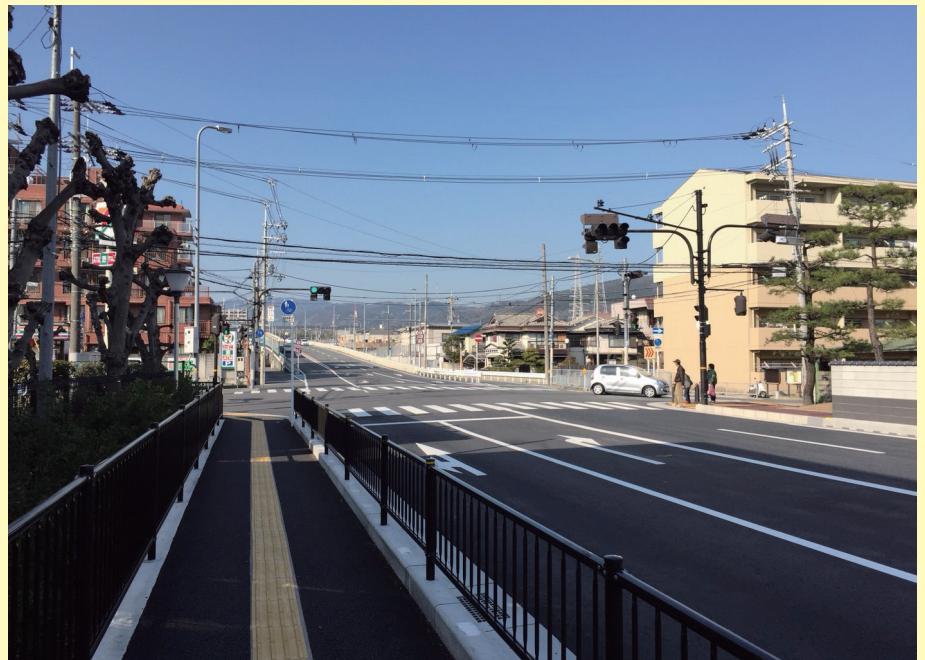
改良後:大阪医科大学横