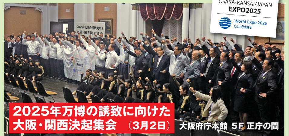
2025年万博の誘致に向けた大阪・関西決起集会 (3月2日) 大阪府庁本館 5F 正庁の間