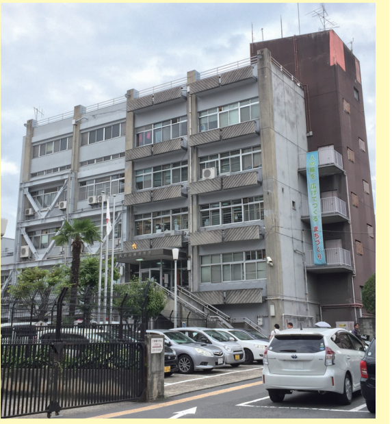
大阪府警察高槻警察署

池下は、これまで1年以上にわたり交渉してきた移転建て替えの候補地である、現高槻市水道局を大阪府へ提案。大阪府警本部長より、改修、増築等では対応が困難となった場合には、高槻市から提示していただいている候補地を含め、移転建て替えの検討を行なっていくとの答弁があった。高槻署は既に増改築が済んでいることから、移転建て替えに一步前進したことになる。