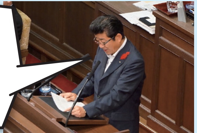
▲池下府議の質問に答弁する松井知事