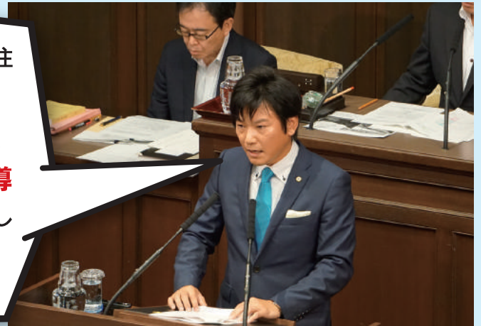
▲松井知事に質問をする池下府議

大阪府として住民にしっかりと市町村の状況をお知らせするよう後押しするとともに、 市町村の要請に基づき 広域連携や合併に関して早い段階から 人的支援等 を行い支援していく。