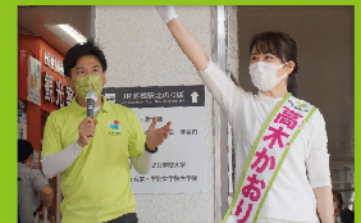
選対事務局長を務めた参院選大阪では2名が当選