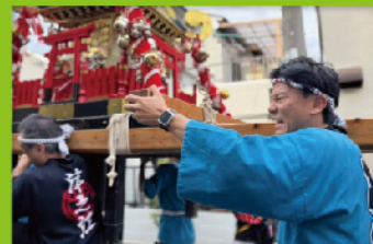
津之江北町のお祭りで地域の皆様と汗をかく