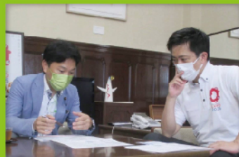
地元の要望を吉村洋文知事に直談判