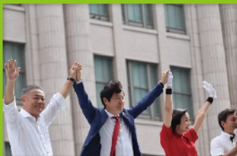
馬場伸幸議員が日本維新の会代表に就任