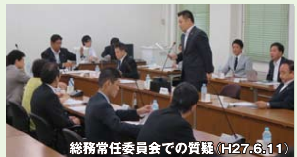
総務常任委員会での質疑 (H27.6.11)

大阪の広域課題を府と大阪、堺両市の首長と議員が協議し、二重行政の解消を目指す「大阪会議」条例案が自民党から提出されましたが、一部条項に違法性が指摘されるなど内容的に問題の多い議案でした。