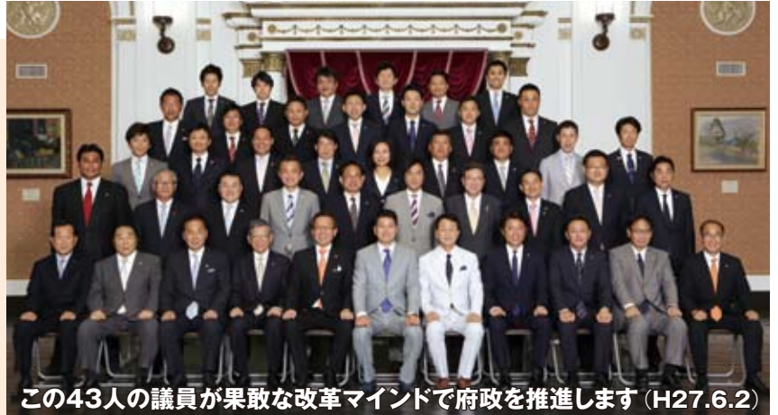
この43人の議員が果敢な改革マインドで府政を推進します (H27.6.2)

府民の皆様の熱いご期待に応えるべく、この4年も、大阪を再生し魅力と活力を生み出すための大都市制度改革をはじめ、公務員改革、教育改革、議会改革など大胆な府政改革を、納税者目線と果敢な改革マインドで断行し、大阪から日本の新しい時代を切り拓いてまいります。