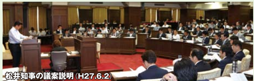
松井知事の議案説明 (H27.6.2)