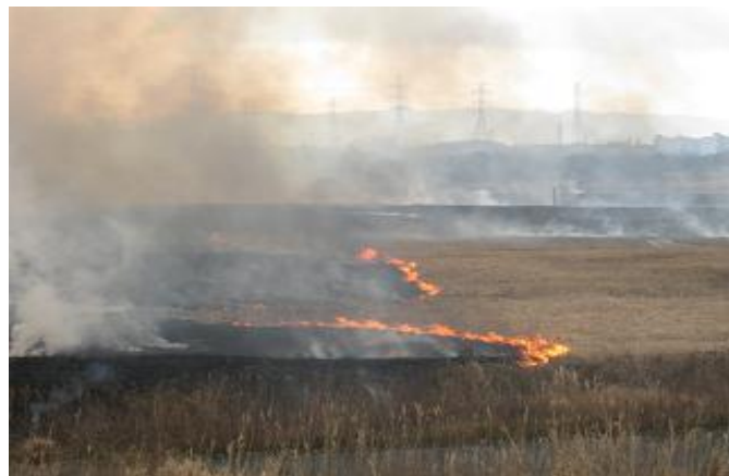
淀川河川敷のヨシ原焼きも様子 ヨシの保全、害虫駆除などのために行われる

しかし、今後の課題も残る。高槻JCTが開通後京都八幡JCT(仮称)の間に鶺鴒のヨシ原(高槻市上牧近辺)が存在する。鶺鴒のヨシ原で採れるヨシが雅楽の楽器である箏篋(ひちりき)蘆舌(ろぜつ)にとって最適なものである。皇室も関わる日本の伝統芸能と自然環境の維持、そして物流のカナメである高速道路の建設、これらをどの様に両立させるかが課題だ。「鶺鴒のヨシ原の環境保全に関する検討会」を傍聴してきたが、さらなる情報収集と最適な方策を考えていかなければならない。