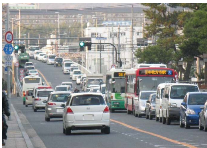
高槻市内の渋滞状況(大阪医大横)

又、アクセス道路が学校の通学路と面している部分があり、現在個別に府の役所に対して改善を要望し対応が図られている。