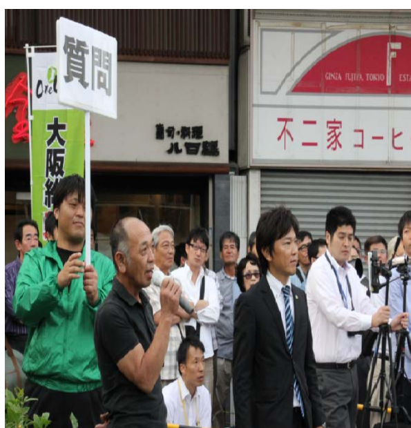
タウンミーティングでは、橋下代表が市民の方からの質問も受ける