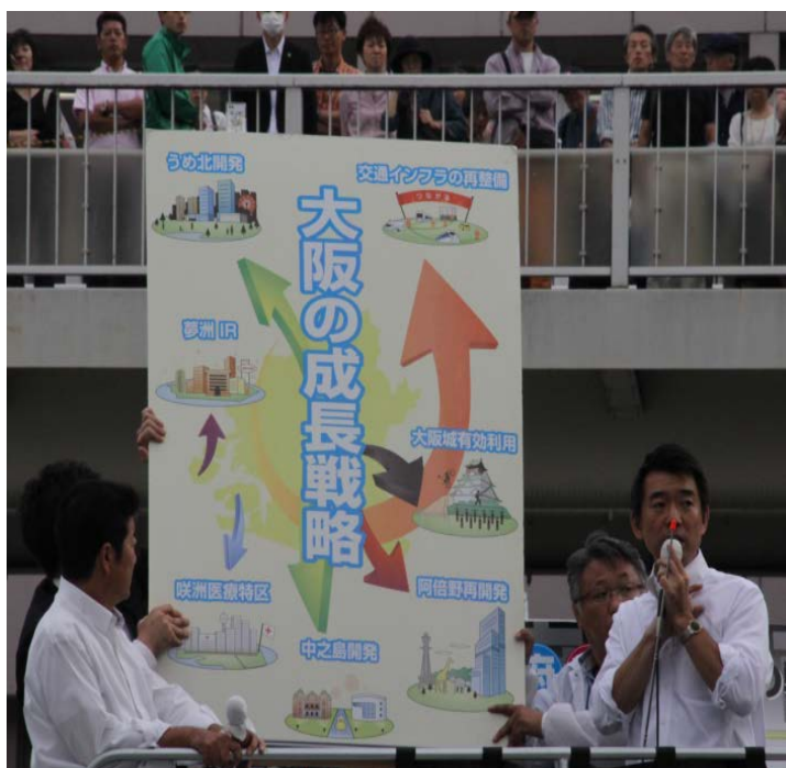
橋下、松井両氏で大阪の景気回復を訴える