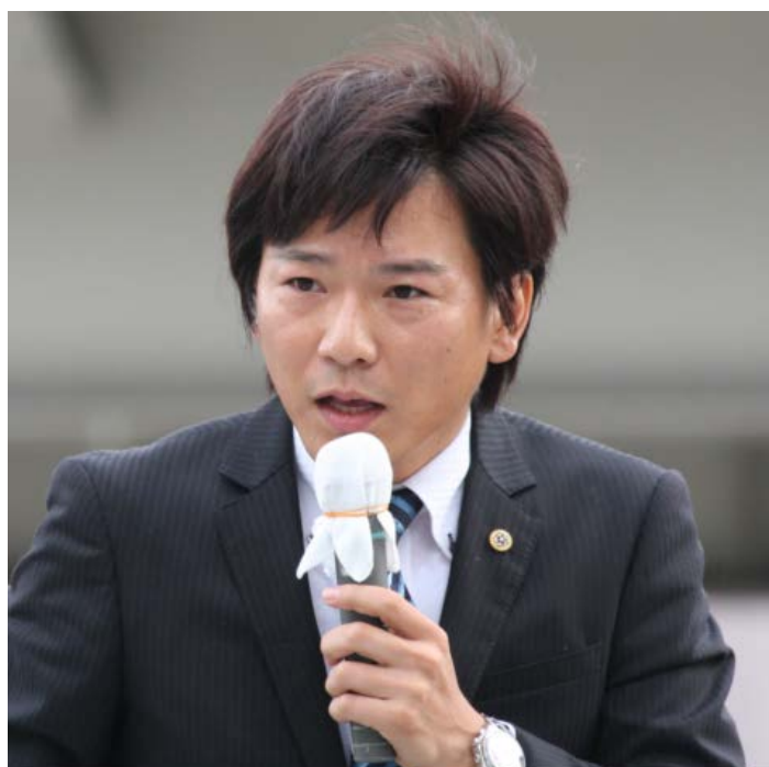
大阪の成長戦略、教育について訴える池下卓府議

10月12日(日)、JR高槻駅北口ロータリーにて、タウンミーティングが開催された。1000名を超える聴衆に見守られ、橋下徹代表、松井一郎幹事長も説明に熱が入る。