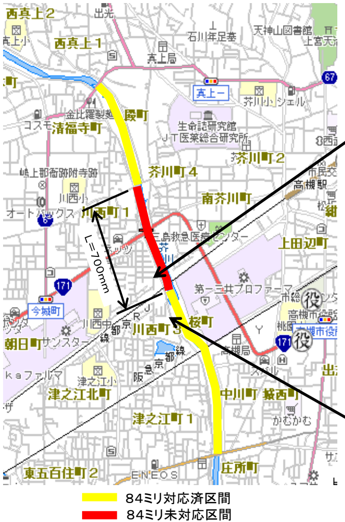
一級河川芥川 箇所図