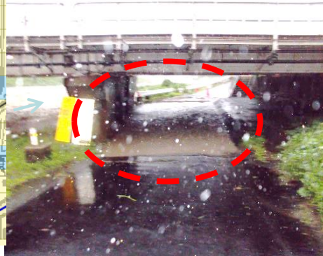
JR橋梁 未改修区間 冠水状況